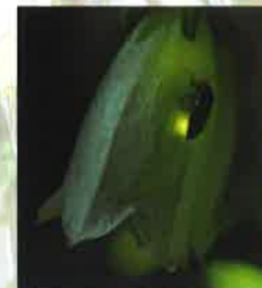
ホタルの夕べ