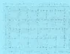
【講師】植物センター ボランティアの会