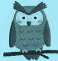
【協力】植物センター ボランティアの会