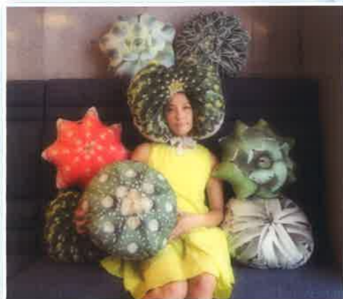
協力: ロッカクケイ