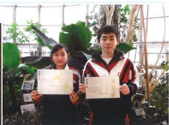
広尾中学校・笹塚中学校