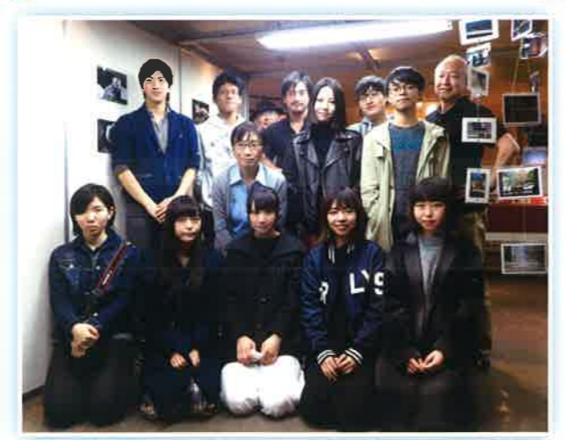
協力：日本写真芸術専門学校