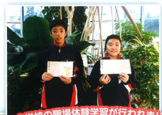
中学校の職場体験学習が行われました。